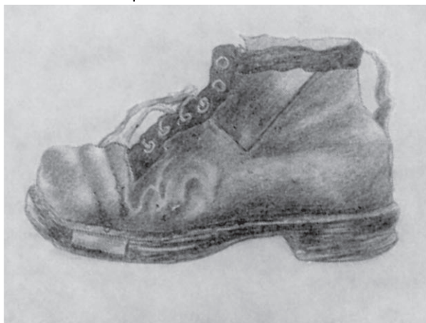
Takováto kresba ukončila Karlovu cestu na uměleckou průmyslovku.

„Podívejte, jak nakreslil tu kobylu,“ povídá ředitel a kupodivu se neubrání troše obdivu. „Víte ... ono to není jednoduché, nakreslit koně... No, ale domluvte mu, ať v té ruštině dává větší pozor...“